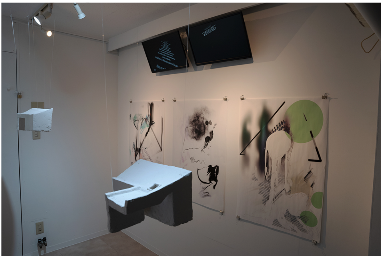
平山好哉 / Yoshiya Hirayama