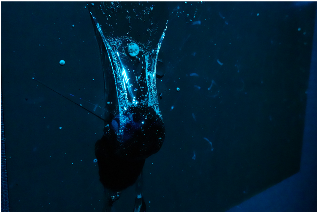
韓成南 / Sung Nam Han