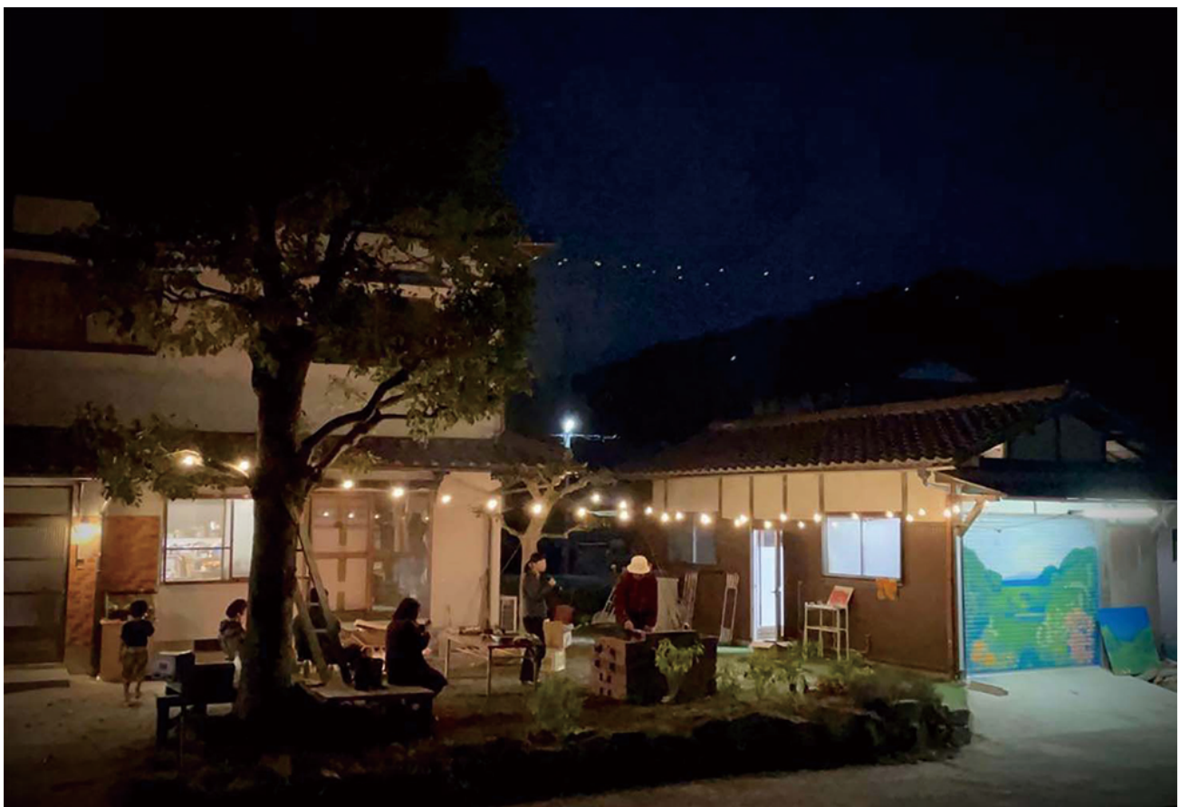
赤星利樹 / Riki Akahoshi