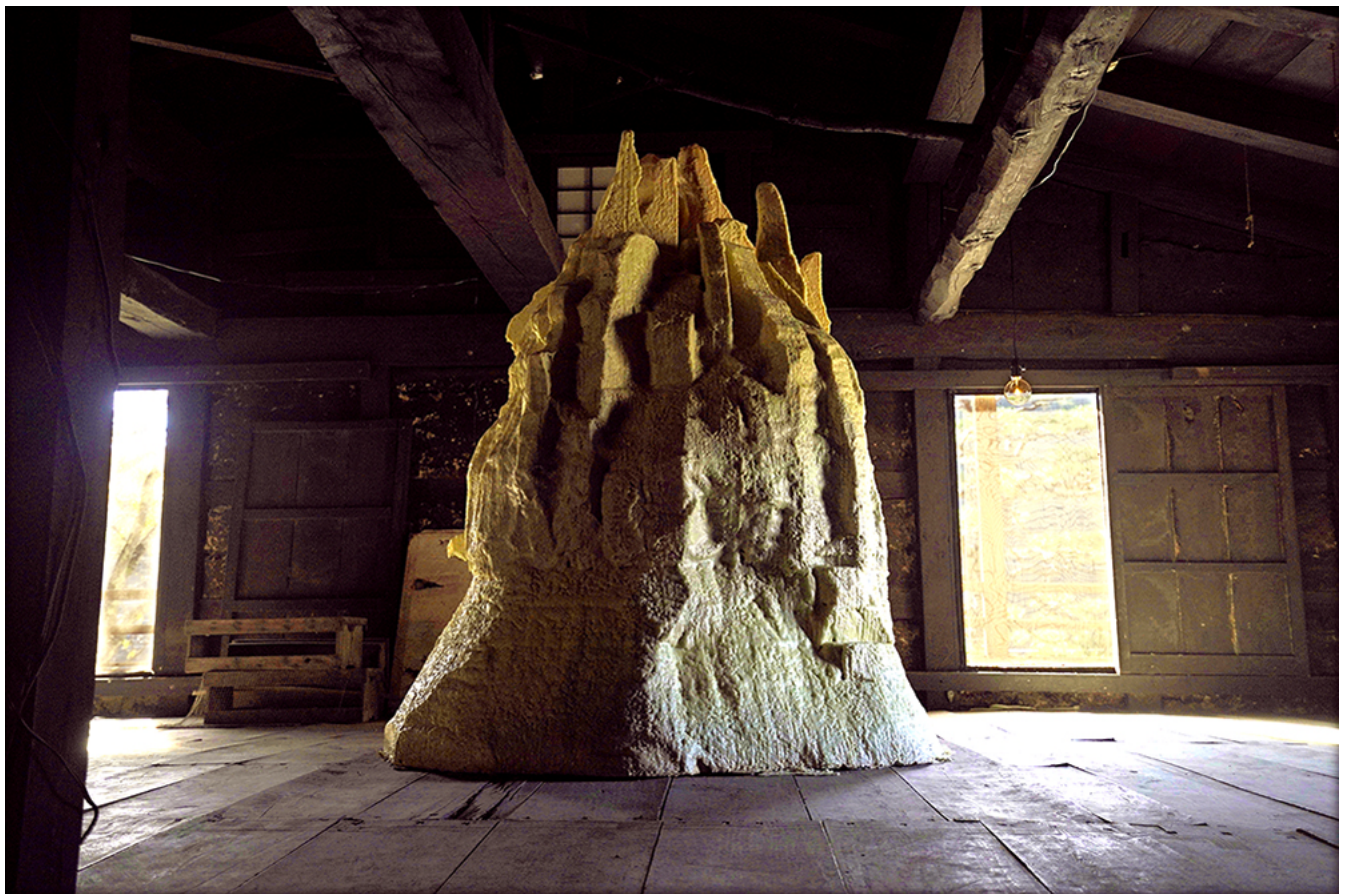
三野綾子 / Ayaco Mino