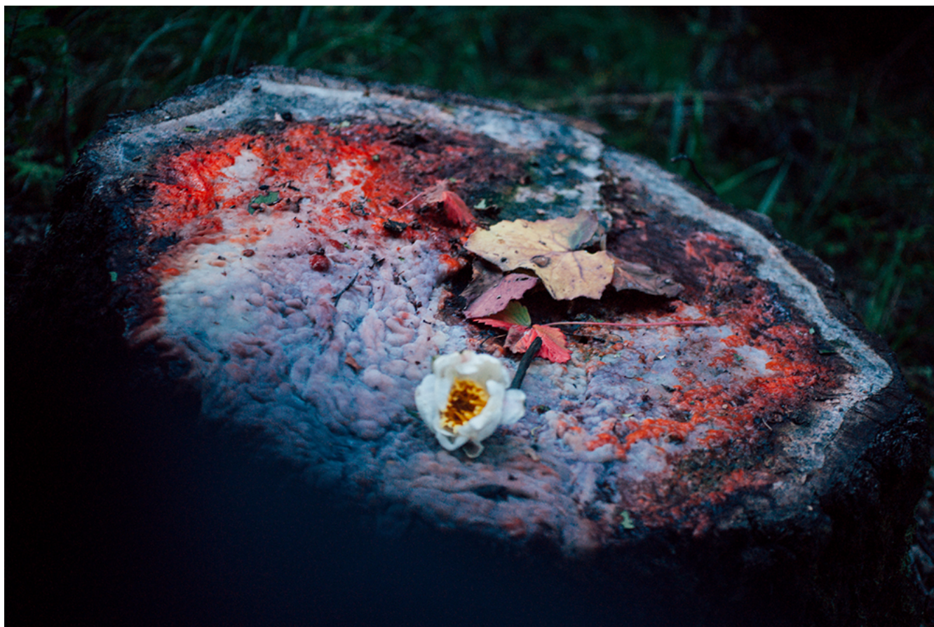
柿崎順一 / Junichi Kakizaki