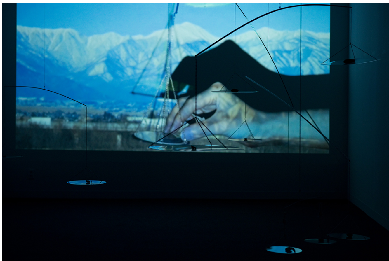
齋藤春佳 / Haruka Saito